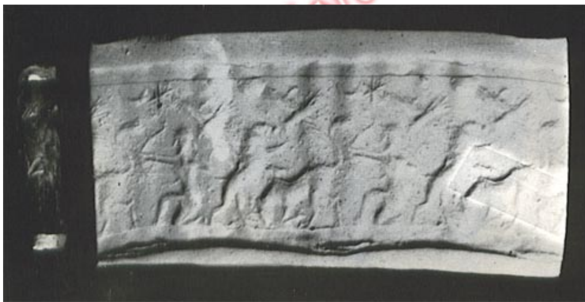
نقش مهر استوانه ای که در روی خمیر مخصوص منعکس گردیده و در آن شکارگاهی نموده شده است: حروف مقطع از نوع میخی علانمی در روی آن دیده میشود.

۱۱- خط پارتی (اشکانی) که با خط پهلوی ساسانی اختلاف داشته است.