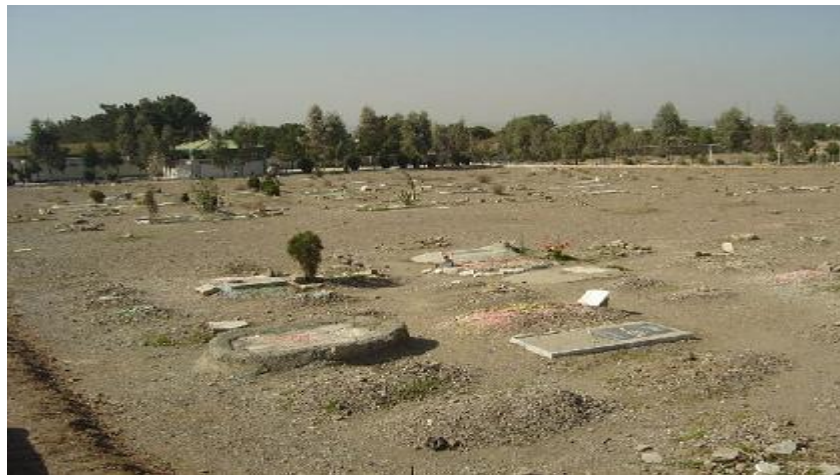
سئوال احمد خمینی در مورد زندانیان سیاسی و صدور فرمان قتل

«... کسانی که در زندان های سراسر کشور بر سر موضع نفاق خود پافشاری کرده و می کنند محارب و محکوم به اعدام می باشند و تشخیص موضوع نیز در تهران با رأی اکثریت آقایان حجت السلام نیری (قاضی شرع) و جناب آقای اشراقی (دادستان تهران) و نماینده ای از وزارت اطلاعات می باشد... در زندان های مراکز استان کشور رأی اکثریت آقایان قاضی شرع، دادستان انقلاب و یا دادیار و وزارت اطلاعات لازم الاتباع می باشد..»