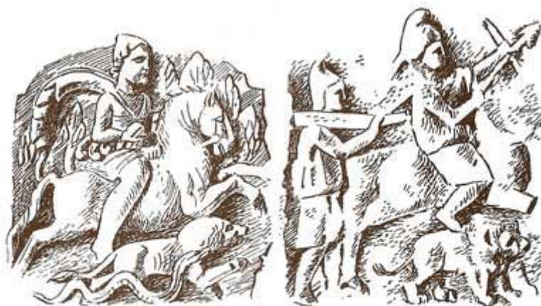
مهر سوار اسب با تیر و کمان، از نقشی در اوستر بورکن، آلمان Vermaseren, Mithras, fig. 26