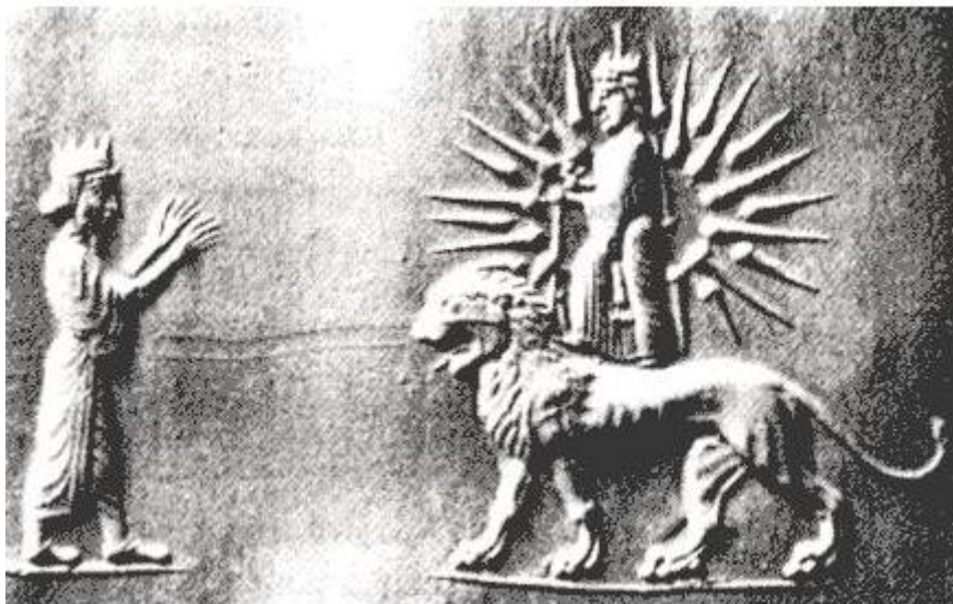
جواد مفرد کهلان

برگه ي ارزشمندی که از سده ي چهارم پیش از زایش مسیح (۲۴۰۰ سال پیش) و در موزه ي آرمنیاز لنین گراد (سن پترزبورگ) نگهداری می شود و پادشاهی هخامنشی را در حضور ایزد مهر شیر سوار نشان میدهد.