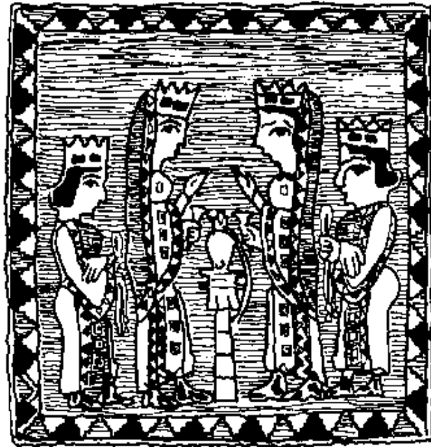
تصویر ۱۵۴ - پارچه‌ی گوبلین از هازیریک، دو زن متشخص همراه خدمتکاران شان در کنار عودسوز

به این ترتیب می بینیم که بی شماری نقش زن عصر هخامنشی وجود دارد، که در آن ها از نظر لباس و کلاه و زیورآلات فرقی میان زن و مرد به چشم نمی خورد. حتی نقش های تشریفاتی مجالس مربوط به شاه، مانند مجلس مشهور بار در فضای مرکزی پلکان بزرگ آپادانا نیز، صورتی است که از طرف زن های امپراتوری بزرگ ایران تقلید می شود (۵۲).