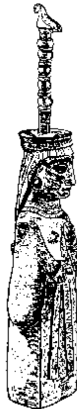
تصویر ۱۷۳. سرمه دان برنزی به شکل یک زن با لباس چین دار هخامنشی

در میان وسایل آرایش، سرمه دانهایی از برنز یافت شده که اغلب به هیئت یک زن ساخته شده است. نمونه ی مجموعه ی خصوصی فروغی از زیبایی خاصی برخوردار است. زنی که به صورت سرمه دان ساخته شده لباس هخامنشی بر تن دارد که به خصوص آستین های اش از زیبایی خاصی برخوردار است (تصویر ۱۷۳).