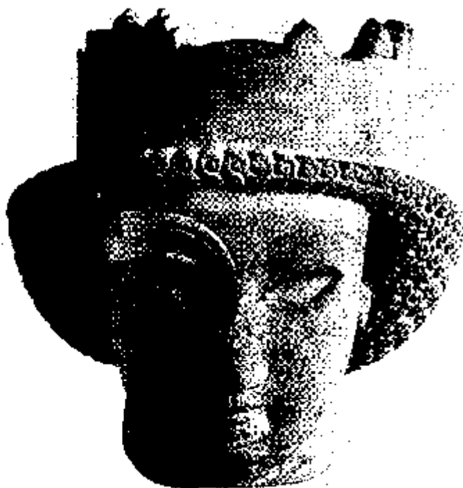
تصویر ۱۷۲ - سری از خمیر شیشه‌ی آبی، تخت جمشید

همین آرایش مو را در سری می بینیم که از تخت جمشید به دست آمده است. این سر به تقلید از سنگ لاجورد، لعابی به رنگ آبی دارد (تصویر ۱۷۲). چشم‌ها و ابروان از لعاب شیشه‌ای و به رنگی دیگر ساخته شده است. این سر می‌توانست از آن یک زن باشد. همچنین سری از سنگ آهک که در مسجد سلیمان پیدا شده، یا سر دیگری از گل پخته از شوش ممکن است زنانه باشد. (۴۲).