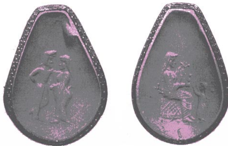
تصویر ۱۷۹ - مهری چهاررویه با تصویر. در یک روی تصویر زن و مردی در لباس ایرانی نقش شده و در روی دیگر زنی نشسته پرنده ای را برای بازی به دخترش می دهد