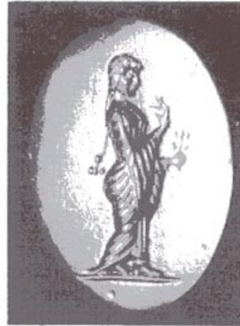
تصویر ۱۷۵ . مهر یک زن با لباس چین دار ایرانی