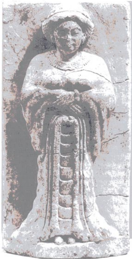
تصویر ۱۷۱ نگاره‌ای از سنگ آهک از مصر، زنی در جامه‌ی ایرانی

همین آرایش مو را در سری می بینیم که از تخت جمشید به دست آمده است. این سر به تقلید از سنگ لاجورد، لعابی به رنگ آبی دارد (تصویر ۱۷۲). چشم‌ها و ابروان از لعاب شیشه‌ای و به رنگی دیگر ساخته شده است. این سر می‌توانست از آن یک زن باشد. همچنین سری از سنگ آهک که در مسجد سلیمان پیدا شده، یا سر دیگری از گل پخته از شوش ممکن است زنانه باشد. (۴۲).