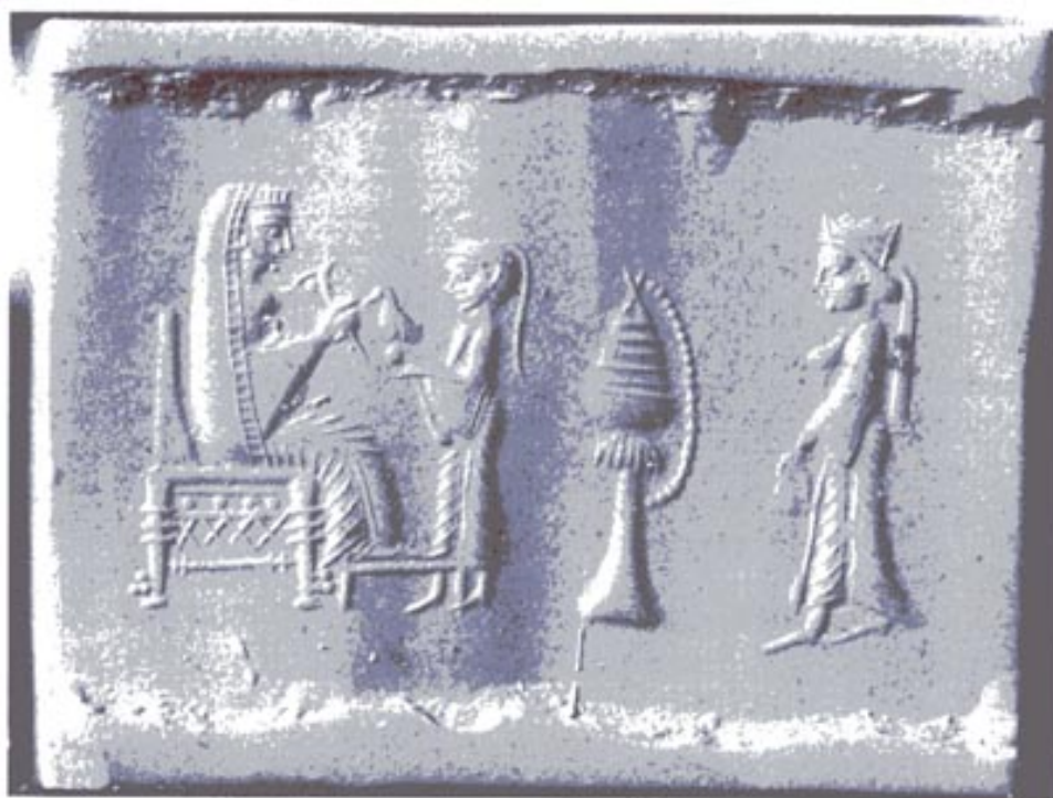
تصویر ۱۷۴. مهر یکی از زنان متشخص ایرانی که شبیه مجلس شاه بر تخت ساخته شده است

به زنانی با این پوشش و لباس اغلب در مهرها هم بر می خوریم. نمونه ی بسیار زیبایی امروز در موزه ی لوور پاریس نگه داری میشود(تصویر ۱۷۴).