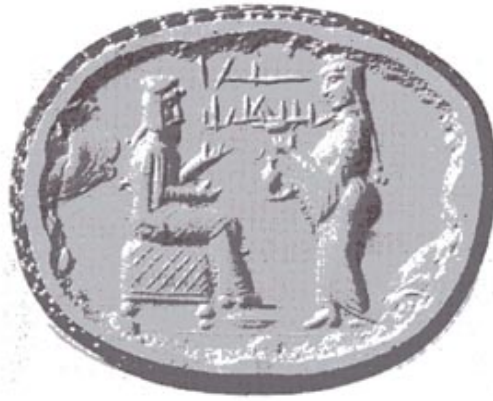
تصویر ۱۷۶ . یک زن ایرانی در حال پذیرایی از یک مرد