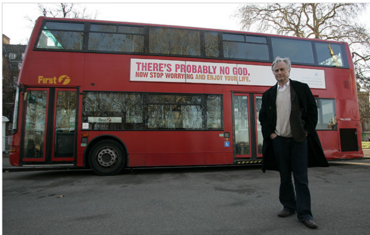
Sir Richard Dawkins.