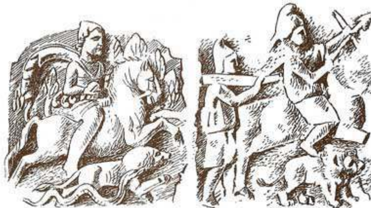
مهر سوار اسب با تیر و کمان، از نقشی در اوستر بورکن، آلمان Vermaseren, Mithras , fig. 26

نزد ملل سامی و اسلامی عید متعلق به مهر گاوکش و بانی چشمه و منسوب به خره به صورت منحصر به فرد آن تحت نام عید قربان محفوظ مانده است که در آن به جای هندوانه شب یلدا گاو یا گوسفندی را قربانی نموده و گوشت آن را تقسیم می نمایند. نام اسماعیل (یعنی خدای شنوا) فرزند هاجر (=صخره، آگدیس تیس فریقها) که عید قربان و پیدایی چشمه سنگی به وی به اختصاص دارد همان ایزد مهر است که در اوستا ملقب به دارنده هزارگوش (یعنی بسیار شنوا) است.